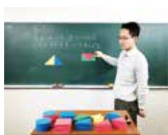
様々な算数の指導に活用できます。柔らかいEVAで安全にしようできます。